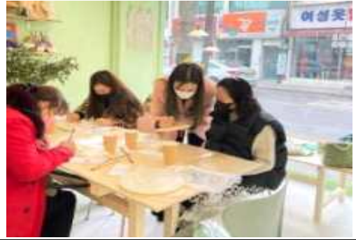
시민 참여 프로그램 운영 사진