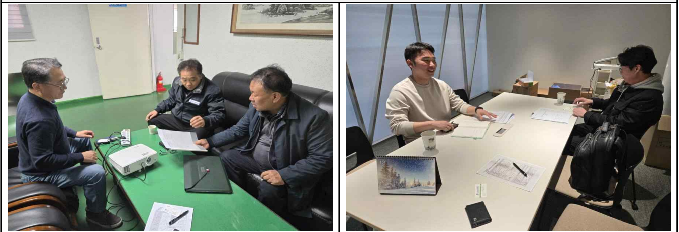
기업현장방문 및 협의체 방문(60회)

□ 산·학·연 전문가 네트워크를 통한 기업 선정·평가 ..... 총 4회