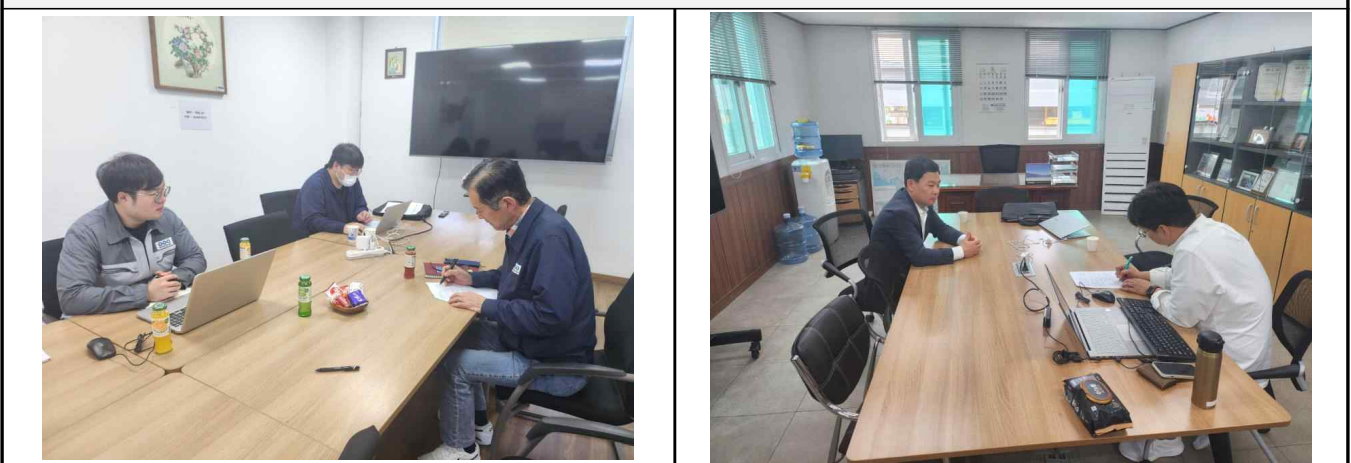
전문가 평가 진행 (4회)

- 지원기업 선정 및 평가 시 관련 분야 전문가로 구성된 평가위원회 활용으로 공정성 확보