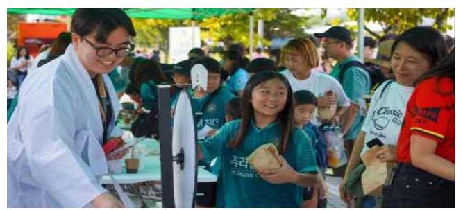
김포 한글 학당