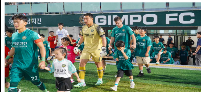
에스코트 키즈 운영