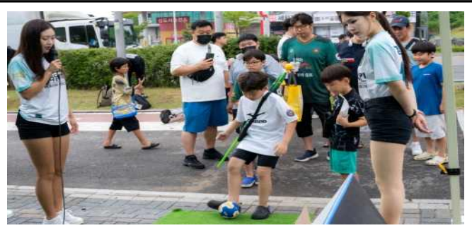
월마운드 슛돌이 이벤트