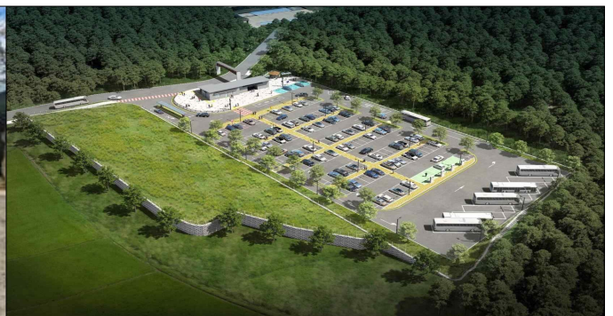
주차장 조성 완료 조감도