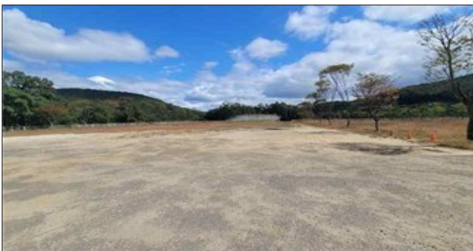
외부 주차장 부지